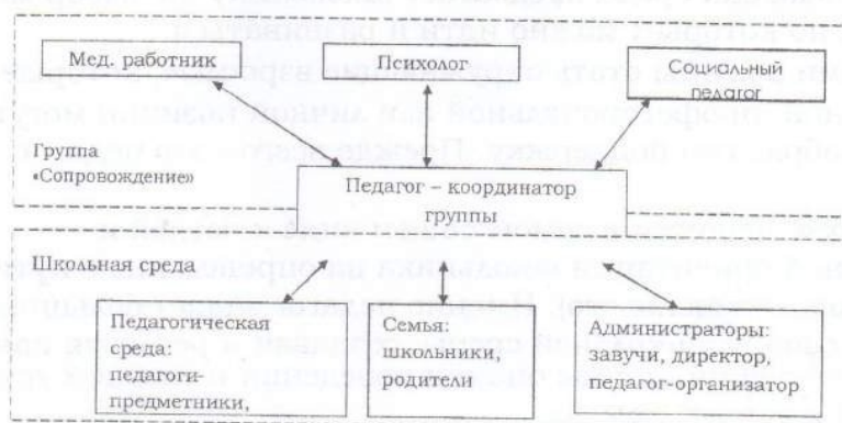
Структурная модель взаимодействия проблемной группы «Сопровождения» со школьной средой Схема 1

С целью оптимизации процесса психолого-педагогического сопровождения, интеграции и координации специалистов, занимающихся проблемами социальной адаптации школьников, можно организовать педагогическую группу «Сопровождение» (см. схему 1). В качестве приоритетного, определено социальное воспитание школьников. Именно школьная среда порождает много ситуаций, требующих от ребенка эмоциональной устойчивости, поведенческой адекватности, коммуникативности, навыков социального саморегулирования, а места их обучения в учебном процессе не отводится, либо отводится, но недостаточно.