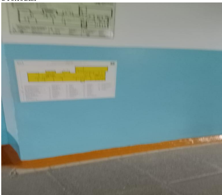
Схема эвакуации выполненная шрифтом Брайля