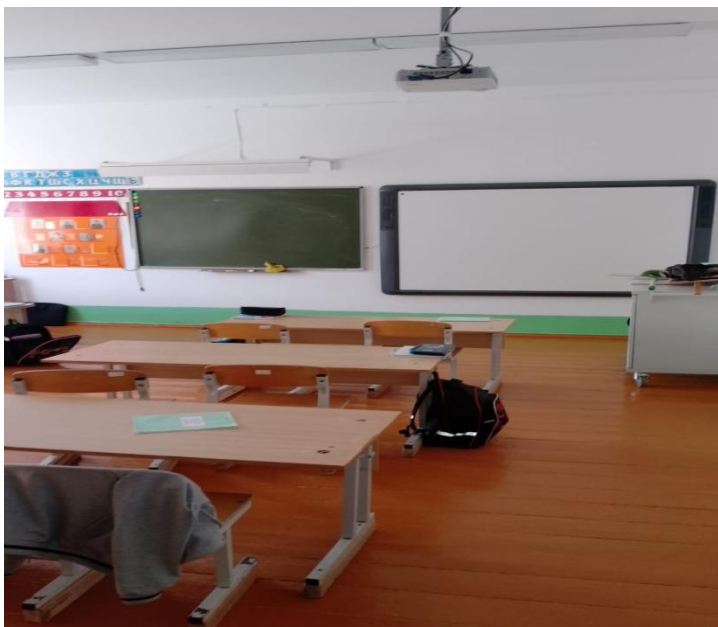
Учебный кабинет оснащенный интерактивной доской и проектором