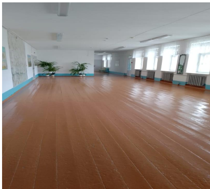
Рекреация 2 этажа